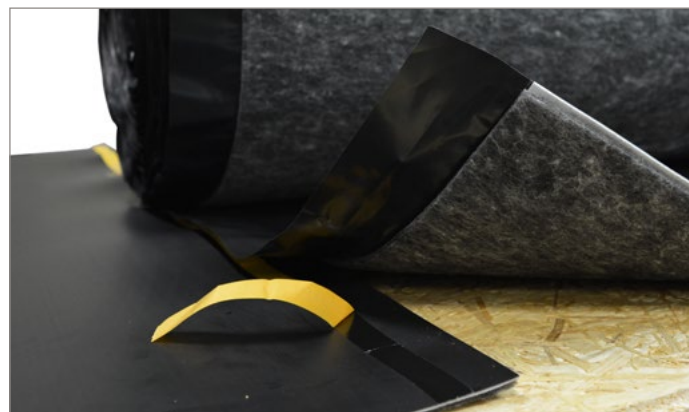
Geïntegreerde zelfklevende zijflap om een eenvoudige plaatsing en een perfecte luchtdichtheid te verzekeren

Voor een ideale ervaring bij het plaatsen van de InsulWood, werd tevens gedacht aan een geïntegreerde zijflap. Deze flap van 5 cm is geheel vlak en verzekert de verbinding tussen de verschillende stroken, zonder enig productverlies. De water- en luchtdichtheid van deze overlappingsstrook, heel belangrijk voor het verminderen van luchtgeluiden, is verzekerd door een zelfklevende strook over de gehele lengte van het product. Het volstaat om het beschermend lint te verwijderen, zodat de overlapping afgedicht wordt.