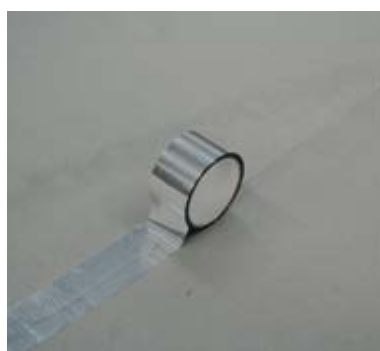
Tape fourni pour assurer l'étanchéité de la jonction.