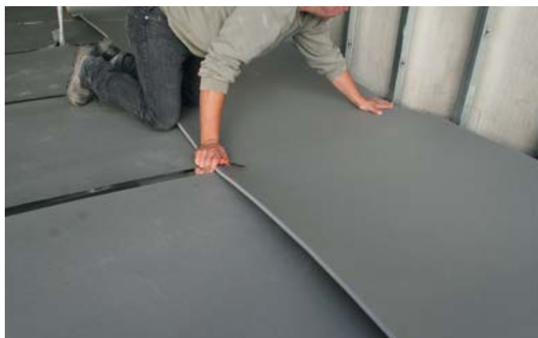
Placer deux épaisseurs d'insulTop 15 en pose croisée pour des performances encore plus élevées.