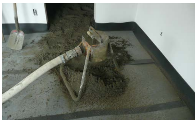
Réaliser une chape renforcée de \pm 8 cm d'épaisseur sur le Bi+20