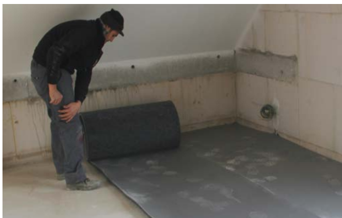
Dérouler les bandes insulit Bi+20 bords-à-bords

Cela le place parmi les meilleures sous-couches du marché et permet de dépasser les exigences les plus sévères de la dernière norme acoustique en vigueur. Grâce à l'insulit Bi+ 20, il est maintenant possible avec une sous-couche de seulement 23 mm d'épaisseur de répondre aux normes d'isolation acoustique et thermique entre étages ! Vous souhaitez réduire le temps de mise en œuvre, l'épaisseur nécessaire et le budget à prévoir ? Contactez un des spécialistes Insulco afin de choisir avec lui la solution la plus adaptée à votre projet.