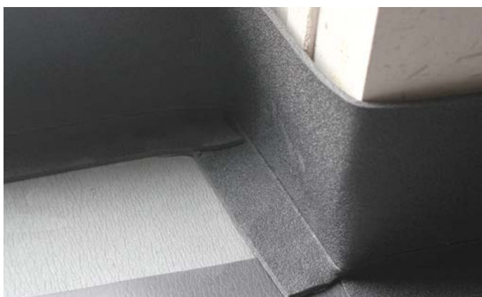
Remonter la bande périphérique Lfoam 18 contre le mur